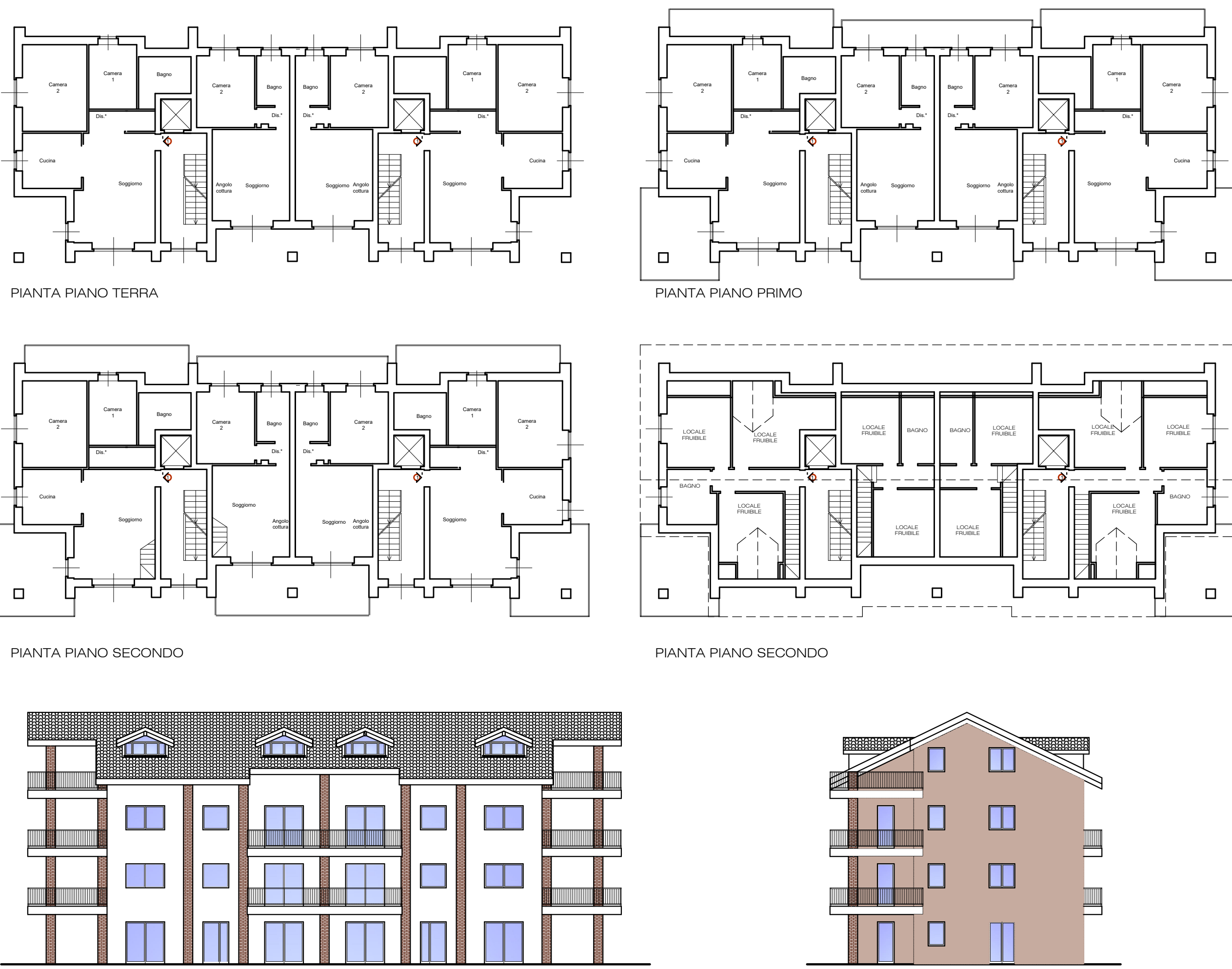
TIPOLOGIA ESEMPLIFICATIVA LOTTO 2 - Scala 1:200