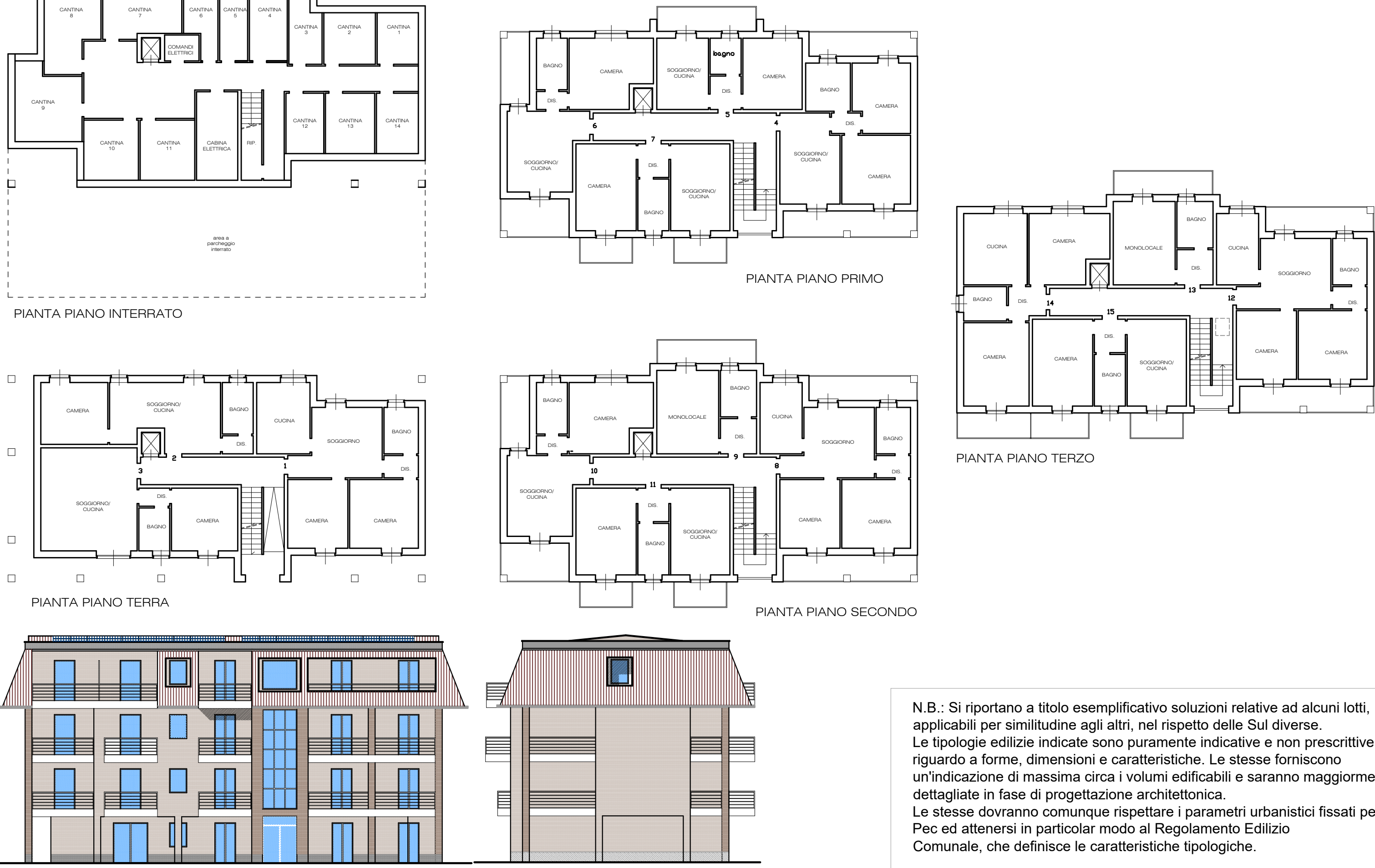
TIPOLOGIA ESEMPLIFICATIVA LOTTO 2 EDIFICIO DI TRASFERIMENTO MASSO GASTALDI- Scala 1:200