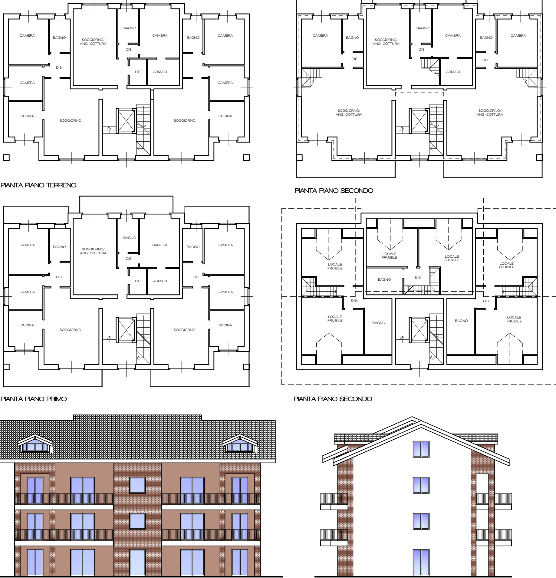
TIPOLOGIA ESEMPLIFICATIVA LOTTO 1a - Scala 1:200