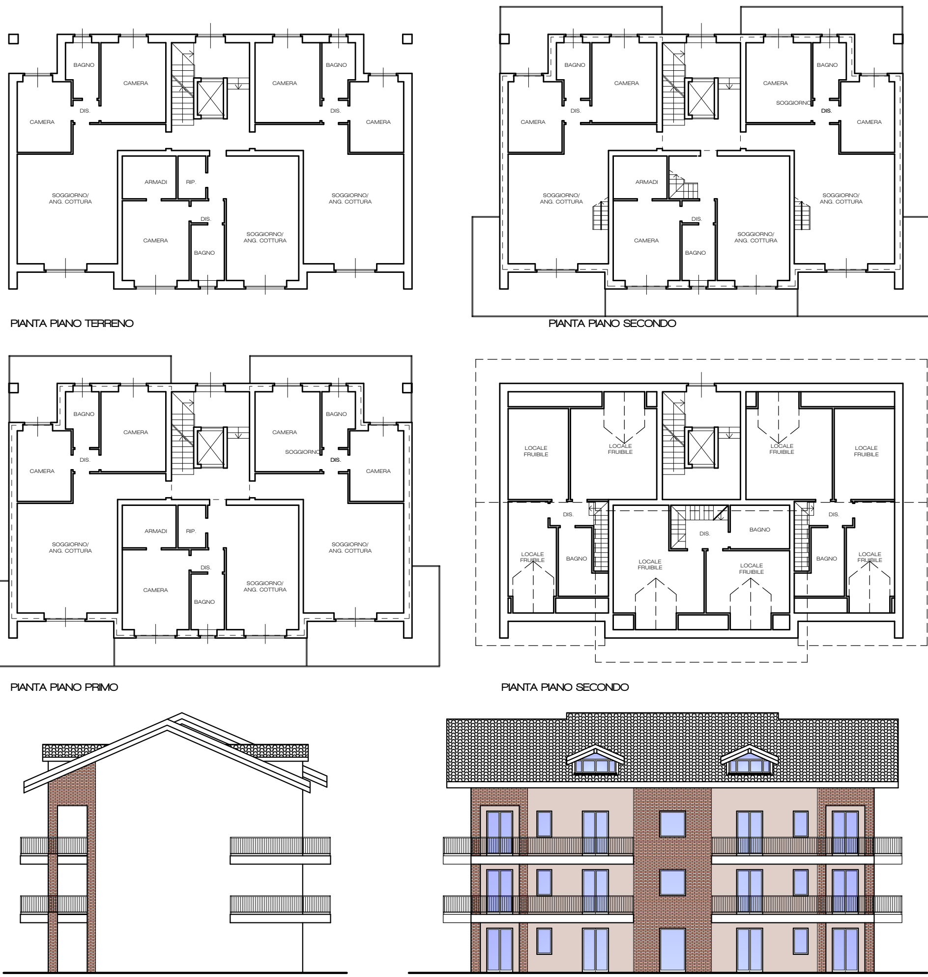
TIPOLOGIA ESEMPLIFICATIVA LOTTO 1b - Scala 1:200